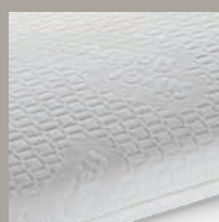
FODERA SFODERABILE STRETCH