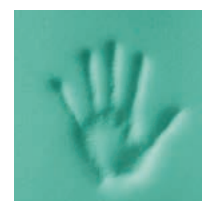
MEMORY FOAM GREEN